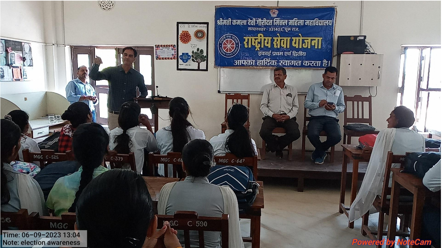
Time: 06-09-2023 13:04 Note: election awareness