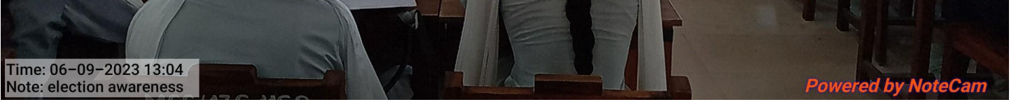
Time: 06-09-2023 13:04 Note: election awareness