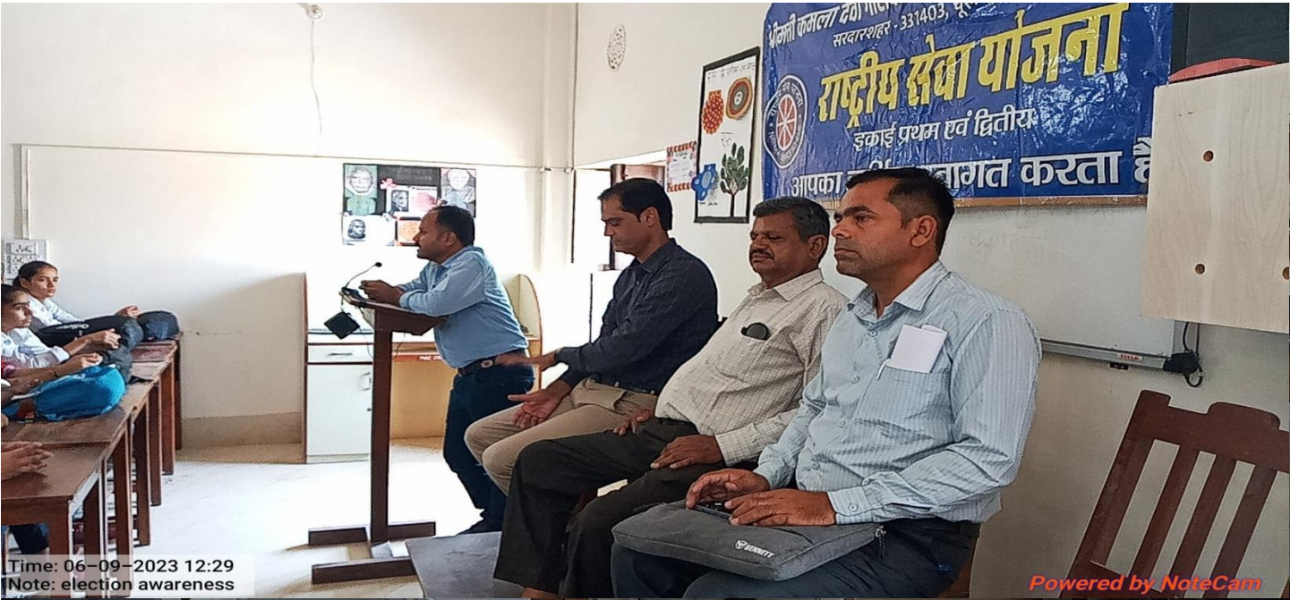
Time: 06-09-2023 12:29 Note: election awareness